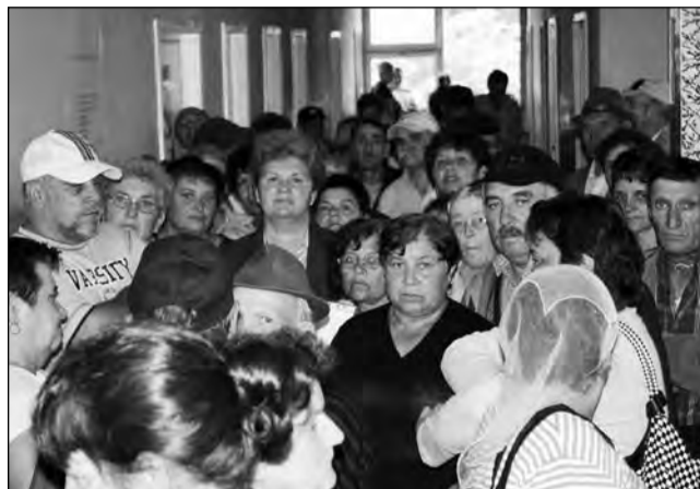
Lipsa de personal a provocat un adevărat război la cabinet

Oboseala și iritarea sunt la ordinea zilei pe holurile policlinicii municipale, unde oamenii s-au înghesuit și la începutul acestei săptămâni la cabinetul de expertiză al CJP. Cabinetul a fost închis până pe 22 iu-