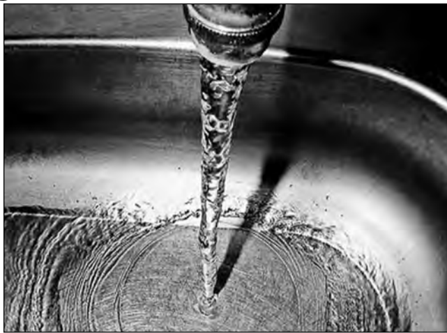
Proiectul își propune îmbunătățirea calității apei

Se va construi o nouă stație de pompare a apei brute, cu o capacitate de 300 litri pe secundă și cu un efect de economisire a energiei electrice. Totodată, se vor reabilita și extinde etapele de pretratare, coagulare, floculare, decantare, se vor reabilita filtrele și procesul de spălare în contracurent a acestora, și se va reabilita și modifica întreg sistemul de